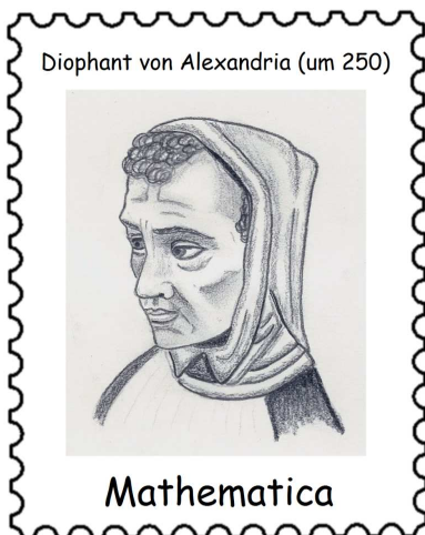
Zeichnung © Andreas Strick 2012

Vor 1750 Jahren wirkte DIOPHANT VON ALEXANDRIA (um 250 n. Chr.)