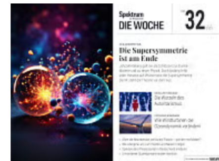
32/2025 Die Supersymmetrie ist am Ende