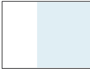
2/3 Seite 663 x 768 px