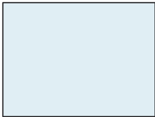
1/1 Seite 1024 x 768 px