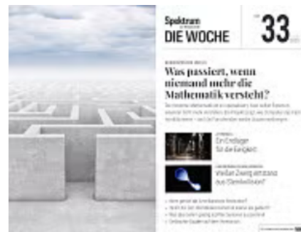
33/2025 Was passiert, wenn niemand mehr die Mathematik versteht?