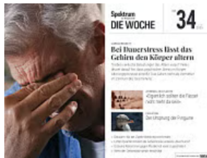
34/2025 Bei Dauerstress lässt das Gehirn den Körper altern