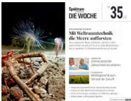
35/2025 Mit Weltraumtechnik die Meere aufforsten