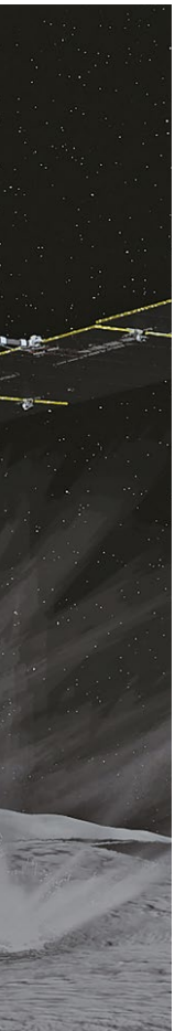
ALMA (ESO/NAOJ/NRAO)/J. Geach et al. ( www.eso.org/public/germany/images/eso2316a/ ) / CC BY 4.0 ( creativecommons.org/licenses/by/4.0/legalcode ); Bearbeitung: SuW-Grafik

JUNGE GALAXIEN Magnetfelder im frühen Universum