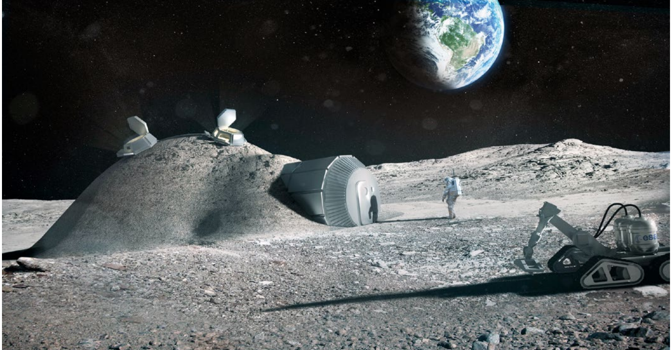
ESA / Foster + Partners

Den Mond bevölkern: Wann werden Menschen in diesem Jahrhundert wieder die Oberfläche unseres Trabanten betreten? Ein Ziel späterer Missionen ist es, Teleskope auf dem Mond zu installieren, die ohne störende Atmosphäre in die Tiefen des Alls vordringen werden.