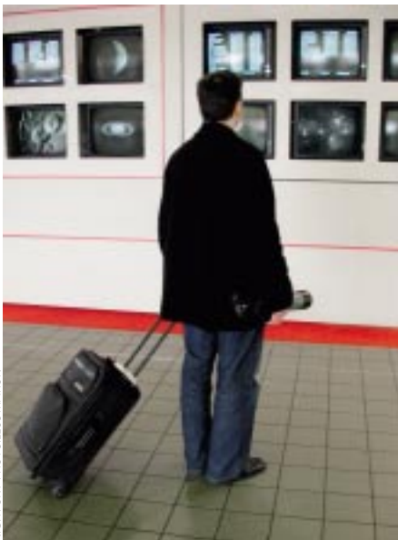
NIGHT SKY PHOTOILLUSTRATION