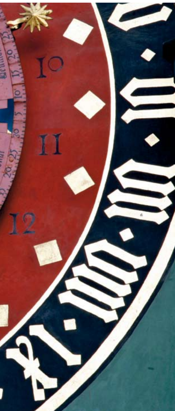
DIE SONNE STEHT IM »LÖWEN« Das Ziffernblatt der Uhr an der »Zytglogge«, einem Glocken- turm in Bern (Schweiz), bietet versierten Betrachtern astrono- mische und astrologische Informationen.

P rägen die Sterne unseren Charakter? Entscheiden sie gar täglich über unser Schicksal? Wer solche Fragen weit von sich weist, stellt sich vielleicht stattdessen diese: Wie kommt es, dass drei von vier Deutschen zumindest sporadisch ihr Horoskop in einer Zeitung oder Zeitschrift lesen, 15 Prozent sogar regelmäßig? Rund jeder zweite davon hat sogar den Eindruck, die Horoskope träfen wenigstens manchmal zu, und immerhin mehr als jeder vierte richtet sich zuweilen nach den Tipps der Astrologen – so die Ergebnisse einer repräsentativen Umfrage des Instituts für Demoskopie in Allensbach aus dem Jahr 2001.