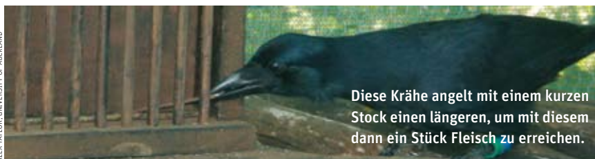
Diese Krähe angelt mit einem kurzen Stock einen längeren, um mit diesem dann ein Stück Fleisch zu erreichen.