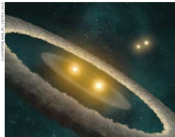
ILLUSTRATION: NASA, JPL / CALTECH / UCLA

Künstlerische Darstellung des Vierer-Sternsystems HD 98800 und der beiden nun entdeckten Ringe mit Lücken, die von Planeten stammen könnten.