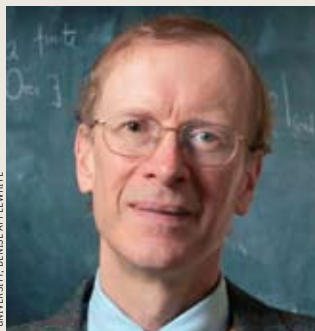
Andrew Wiles (*1953)

Spektrum: Nochmals gefragt: Wenn Beweise diese Umfänge annehmen und von Kollektiven erarbeitet werden – wie kann man das alles glauben?