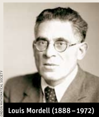
Louis Mordell (1888 – 1972)