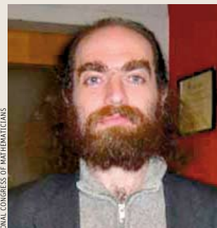
Grigori Perelman (*1966)