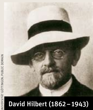
David Hilbert (1862 – 1943)