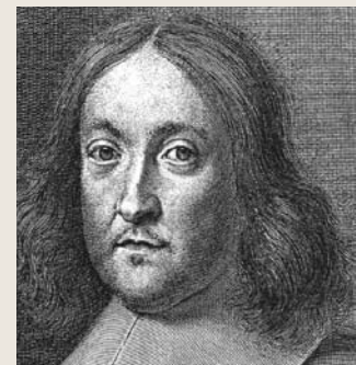
P. de Fermat (1607 – 1665)