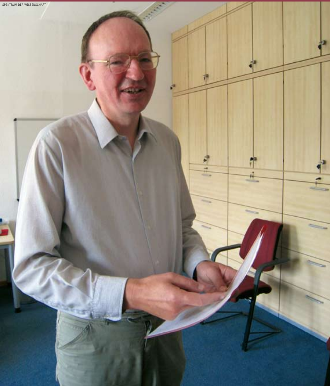
Gerd Faltings, Direktor am Max-Planck-Institut für Mathe- matik, Bonn