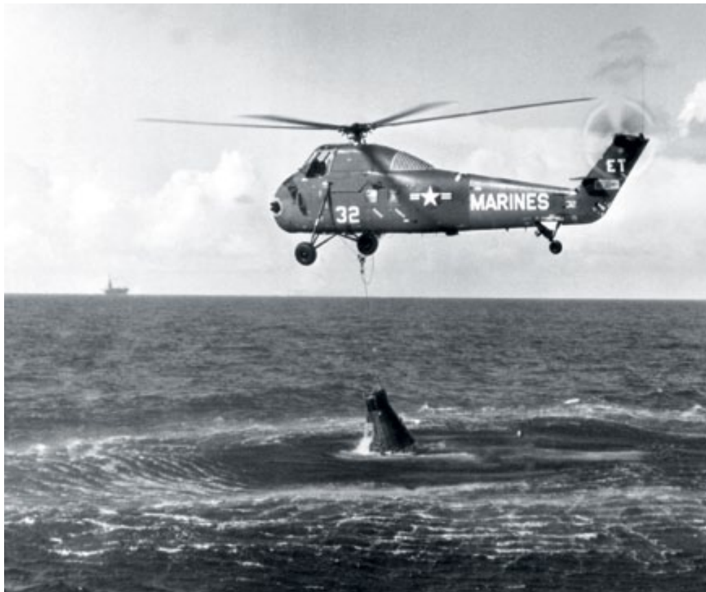
Bergung der Weltraumkapsel „Liberty Bell“ durch einen Marine-Hubschrauber nach dem 2. ballistischen Flug im Jahre 1961.