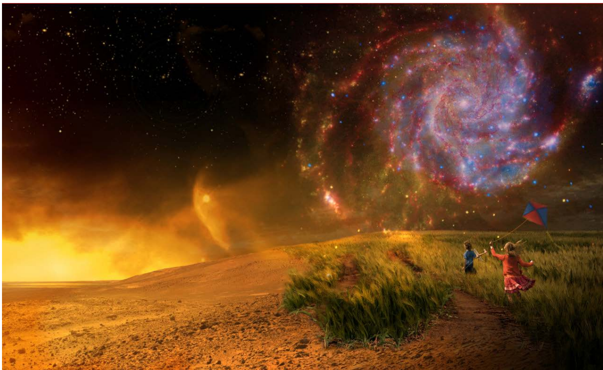
Abbildung 1: Das Bild zeigt mit künstlerischen Mitteln, wie die Entdeckung bewohnbarer Planeten außerhalb unseres Sonnensystems unsere Gedankenwelt beeinflusst. Die Bewohnbarkeit kann den irdischen Verhältnissen sehr nahekommen (dargestellt in der unteren rechten Ecke des Bildes) oder aber unzumutbar sein (linke Seite des Bildes). Am erfolgreichsten ist es vielleicht, die Suche auf fernere Teile der Milchstraße auszudehnen (rechts oben).